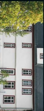
Viseum – Haus der Optik und Feinmechanik