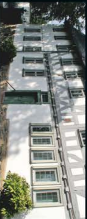
Lottehaus – Literarische Gedenkstätte