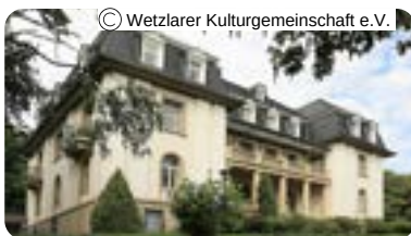
Haus Friedwart Laufdorfer Weg 6 35578 Wetzlar