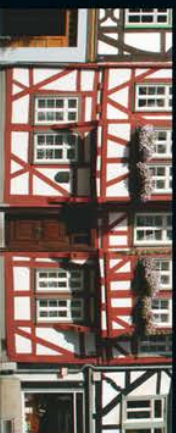
Jerusalemhaus – Literarische Gedenkstätte