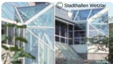
Stadthalle Wetzlar Brühlsbachstraße 2b 35578 Wetzlar