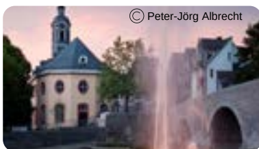
Hospitalkirche Haarplatz 35576 Wetzlar