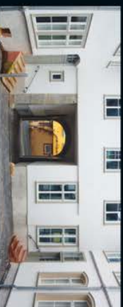
Palais Papius – Europäische Wohnkultur