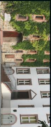
Stadt- und Industriemuseum