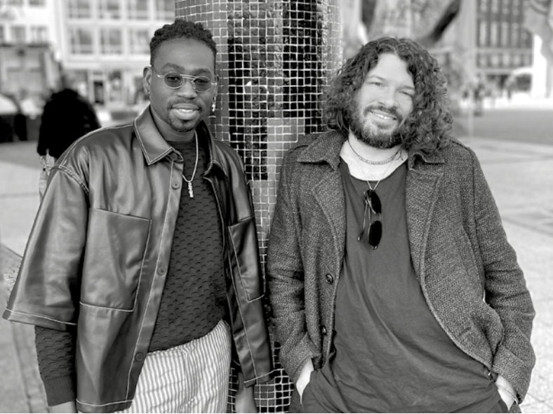
© Khadim Seck und Max Clouth