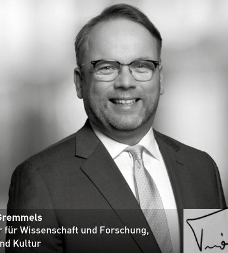
Timon Gremmels Minister für Wissenschaft und Forschung, Kunst und Kultur

Wir wünschen Ihnen einen rundum inspirierenden, musikalischen 5. Mai mit viel Entdeckerfreude in Ihrem Musikland Hessen.